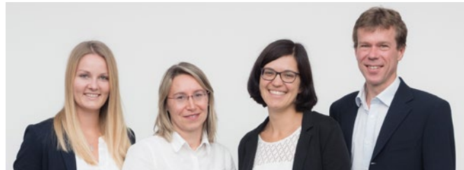
Das Team der Geschäftsstelle der Plattform EE BW

Plattform Erneuerbare Energien Baden-Württemberg e.V. Meitnerstr. 1, 70563 Stuttgart +49 (0) 711 7870-309 info@erneuerbare-bw.de www.erneuerbare-bw.de